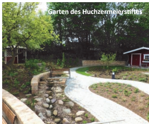
Garten des Huchzermelerstiftes