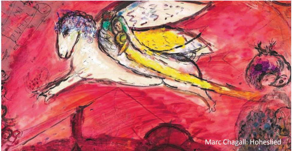
Marc Chagall: Hohelied