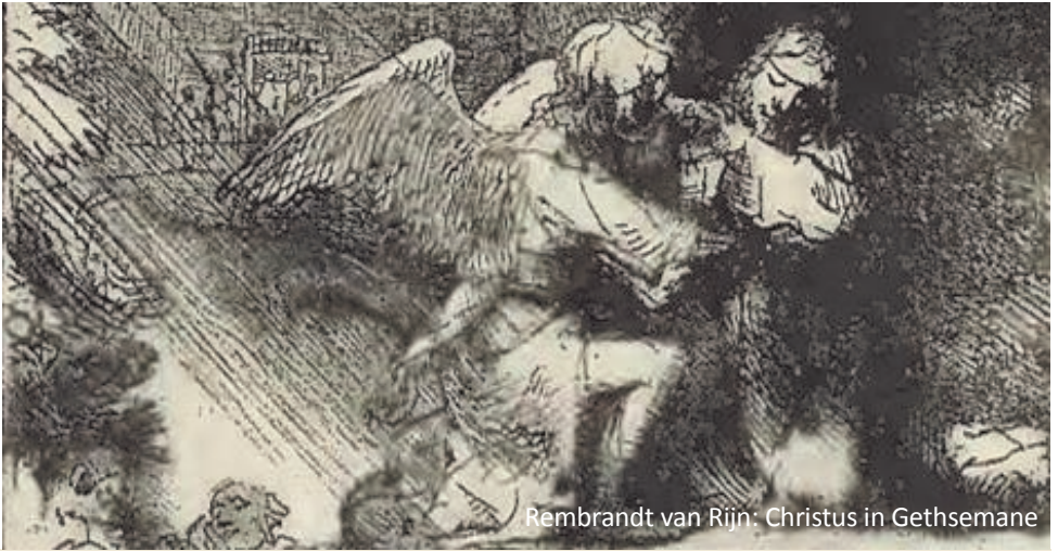
Rembrandt van Rijn: Christus in Gethsemane