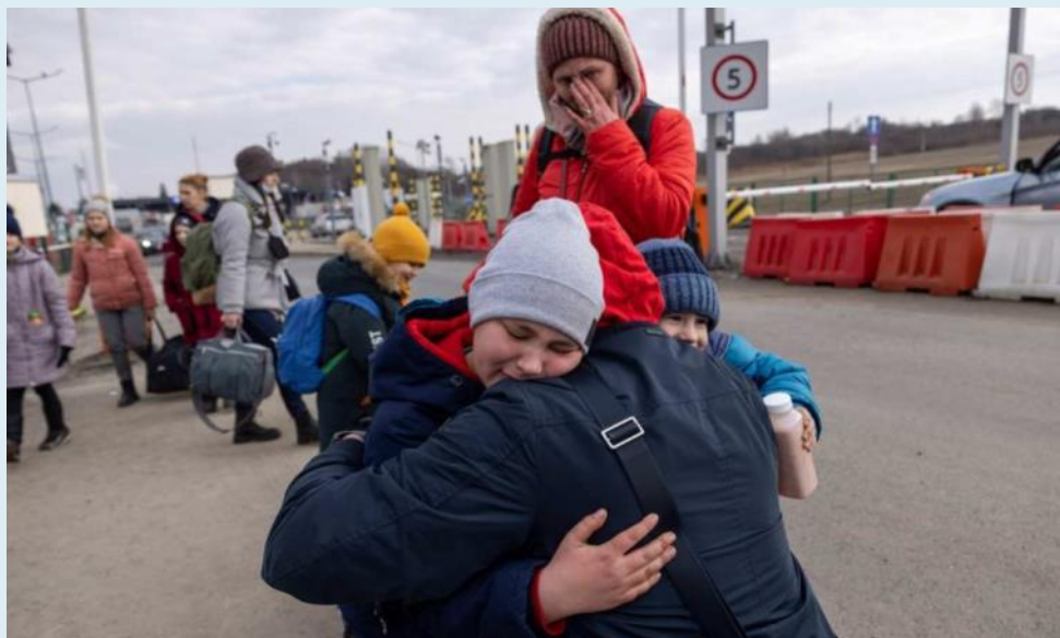
Ankunft ukrainischer Flüchtlinge am polnisch-ukrainischen Grenzübergang Medyka.